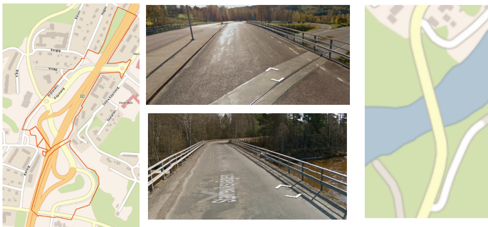
Bild 2: Trafikplats Timrå med bron över E4 och bro över Ljustorpsån

Avsikten är att genomförandet ska ske med medfinansiering/samverkan. Intill dess att avtal om samverkan träffats mellan parterna ska följande avsiktsförklaring gälla mellan parterna.